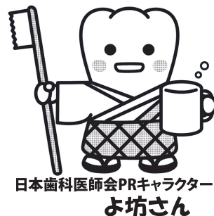
日本歯科医師会PRキャラクター よ坊さん